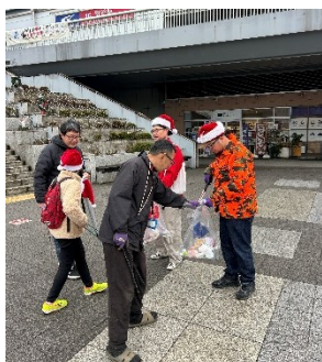
雨の中集まってくれた 参加者の皆さん

当初は、21 日の午前中に実施予定でしたが、雨天のため 23 日の夜に時間を変更して開催されました。寒さ対策として使い捨てカイロを配布し、16 名の参加者一人ひとりへの気配りが行き届いており、暗い場所では足元へ注意を促すなど、安全面にも十分配慮しながら活動が進められました。